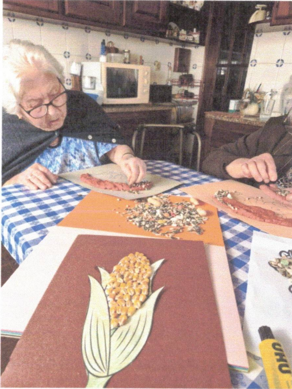
Atividade no domicílio