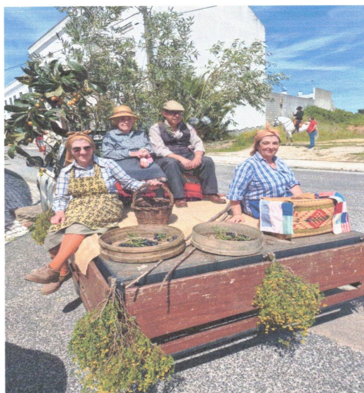
Festa dos Fazendeiros