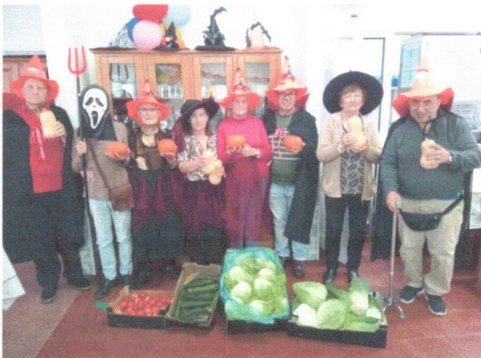
Festa de Halloween, com receção do Cabaz de hortícolas da Quinta do Sampayo