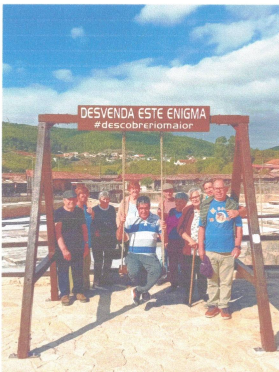
Salinas de Rio Maior