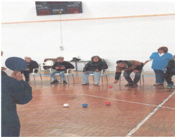
Torneio Boccia, Inatel