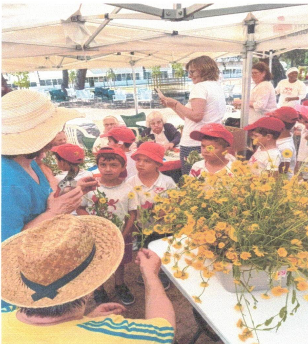
Dia da Espiga