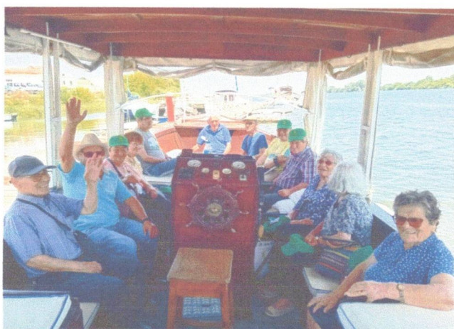
Passeio no Tejo