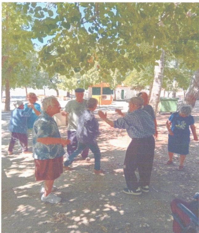
Convívio em Valada