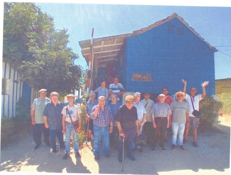
Visita à Aldeia Avieira da Palhota