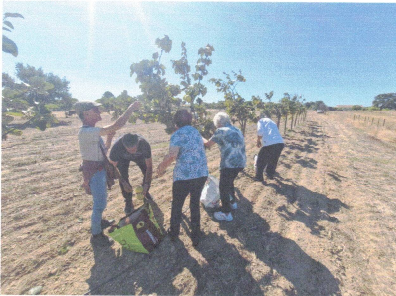
Apanha de marmelos