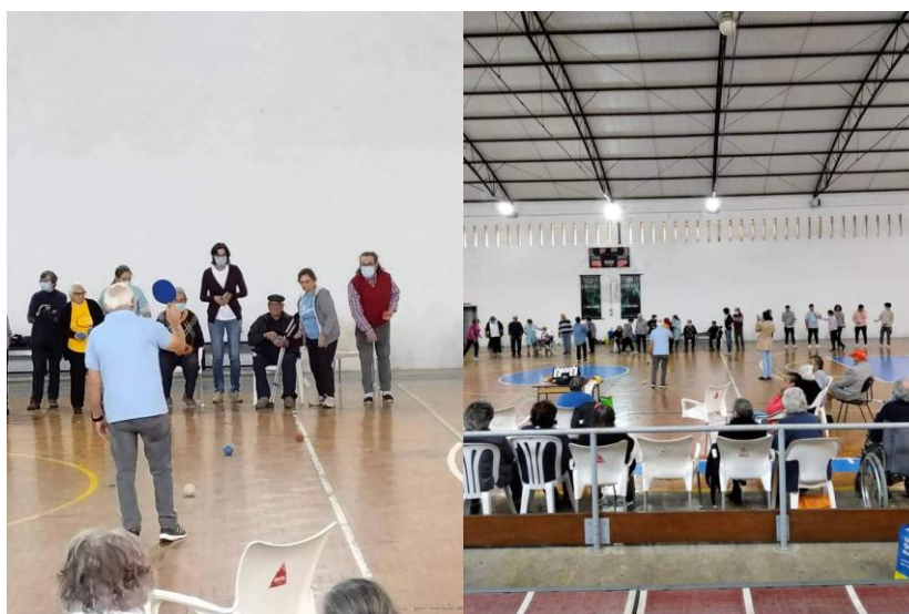
Demonstração de Boccia