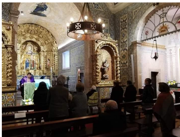
Participação nas Missas