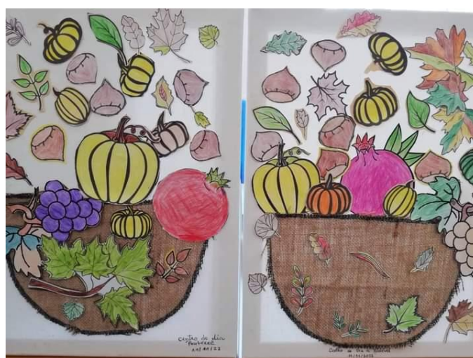
Trabalhos alusivos ao Outono