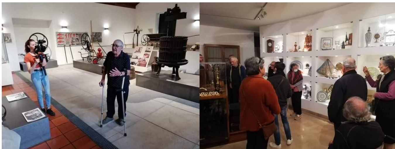
Visitas aos Museus