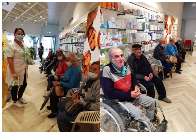
Rastreio de Saúde na Farmácia no âmbito da Semana da Saúde