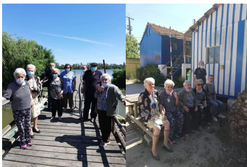
Visita à Palhota