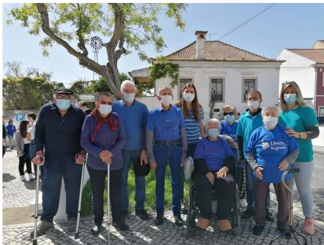
42 Aniversário Make-A-Wish