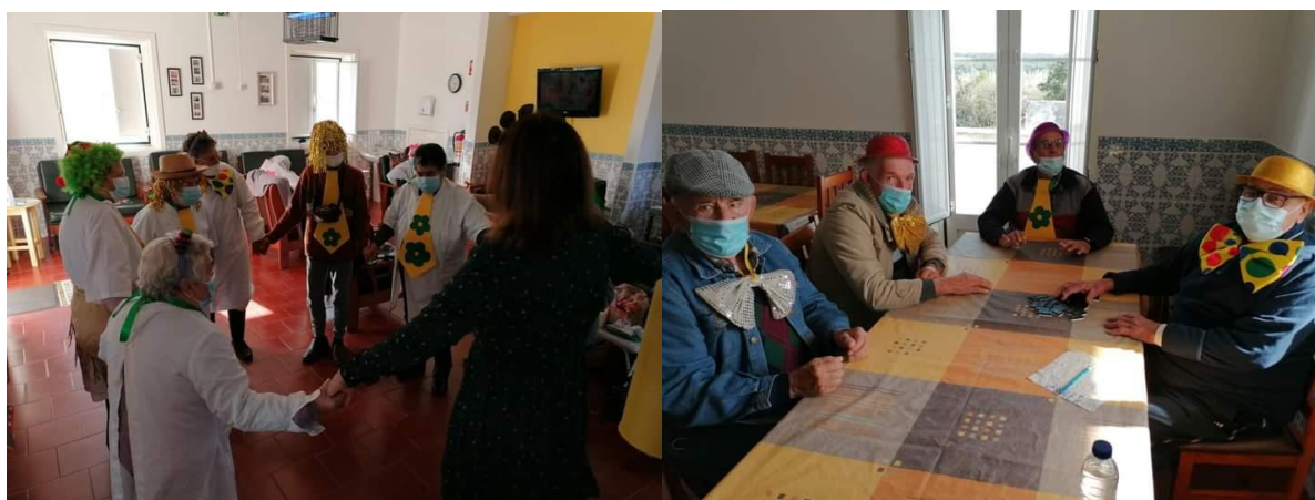
Comemorações e Baile de Carnaval