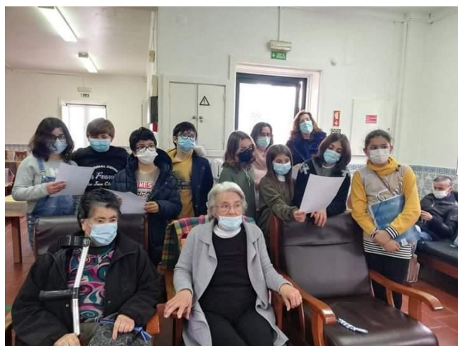
Visita dos alunos da Escola EB23 Pontével