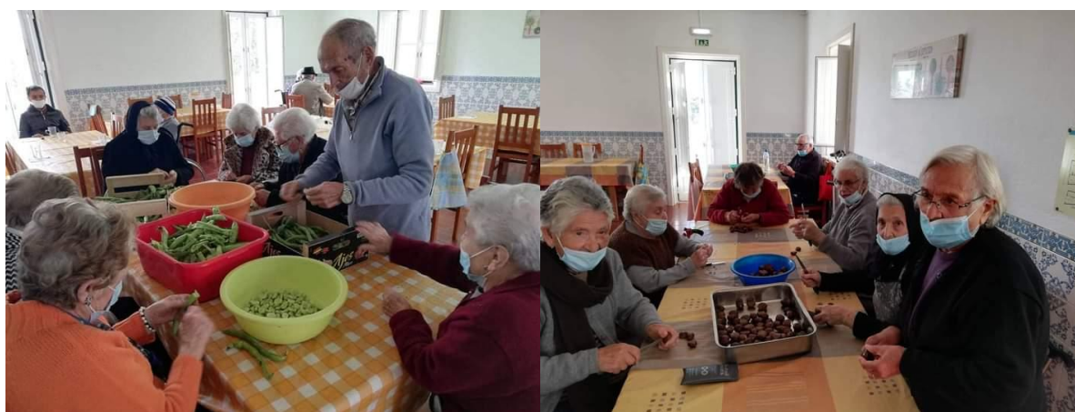
Culinária – Preparação de Favas para Sopa e Castanhas para o Magusto