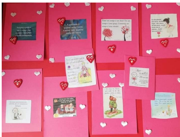
Resultado dos postais feitos para a comemoração do Dia dos Namorados