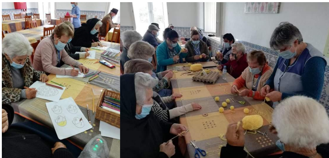
Trabalhos Manuais alusivos à Páscoa