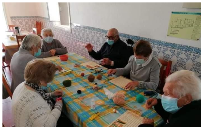
Realização de Trabalhos Manuais para o Projeto “Troca de Correspondência”